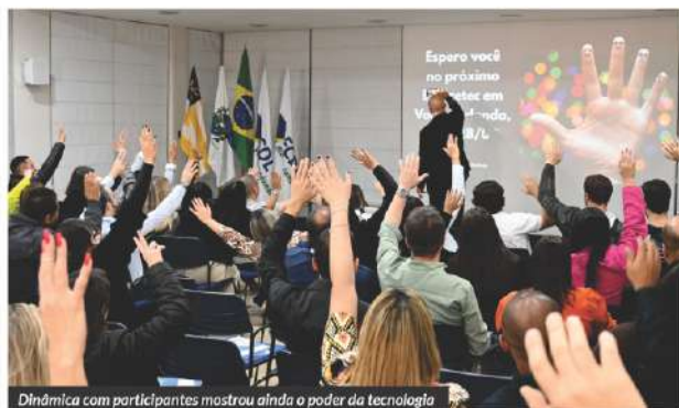
Dinâmica com participantes mostrou ainda o poder da tecnologia

Gameleira também falou sobre voltar à cidade depois de quase cinco anos sem estar em Volta Redonda e o quanto percebeu o crescimento econômico do município.