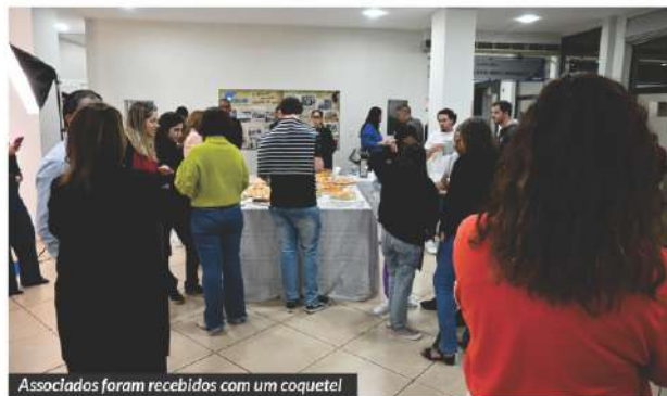
Associados foram recebidos com um coquetel

balhou em importantes agências de publicidade do Rio de Janeiro e foi um dos conselheiros do apresentador Roberto Justus, no reality show “Aprendiz – O Sócio”. Desde 1998, ele é facilitador-líder do seminário Empretec, um programa desenvolvido pela ONU (Organização das Nações Unidas) e implantado no Brasil pelo Sebrae, hoje aplicado em mais de 40 países, com um total de mais de 12mil horas de treinamento comportamental para empresários dos mais diversos segmentos. Suas áreas de atuação são empreendedorismo, inovação, gestão empresarial e marketing. 🇺🇸