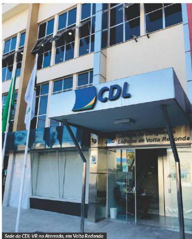
Sede da CDL-VR no Aterrado, em Volta Redonda

A entidade é atuante política e socialmente, defendendo os interesses dos lojistas e do setor produtivo em geral, evitando que leis municipais sejam aprovadas, de forma a onerar a carga tributária. Também acompanha projetos que possam ajudar a melhorar a segurança pública, apoiando ações que contribuem para o desenvolvimento da cidade e incentivem ainda a responsabilidade social.