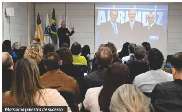
Mais uma palestra de sucesso